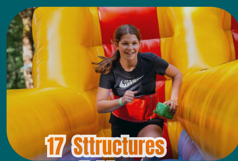
17 Structures gonflables