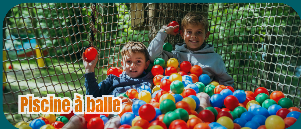
Piscine à balle