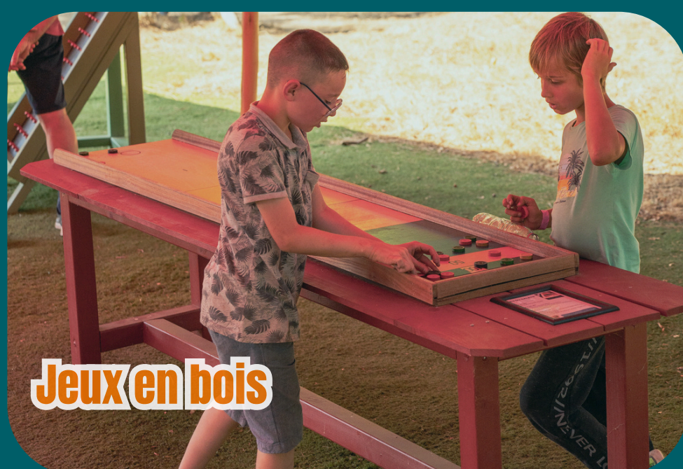
Jeux en bois