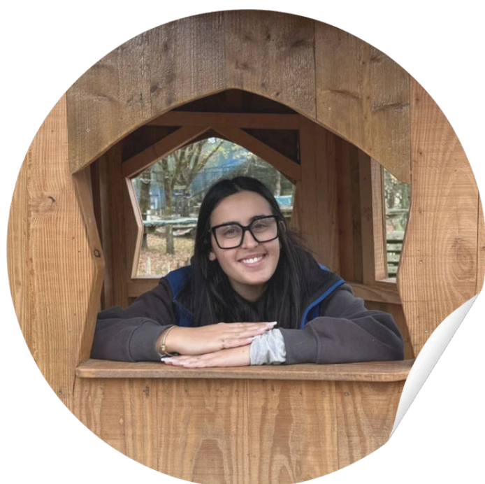
Assia Community manager

« Les réunions de famille à rallonge autour d'une table, c'est épuisant ! Entre tata qui demande pour la énième fois ce que tu deviens et tonton qui profite un peu trop du bar... pas de panique, la solution est toute trouvée ! Venez organiser votre journée en famille au parc de loisirs La Vallée des Korrigans.