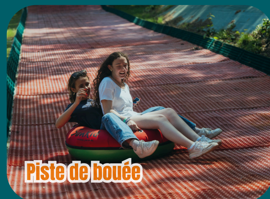
Piste de bouée