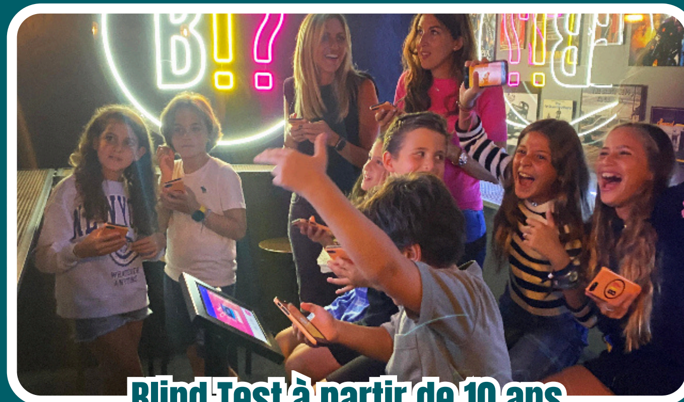
Blind Test à partir de 10 ans