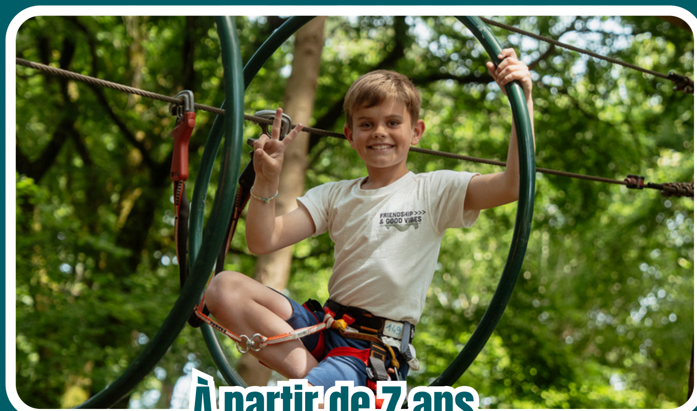
À partir de 7 ans