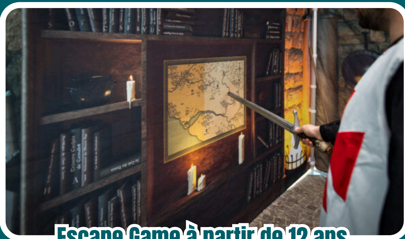
Escape Game à partir de 12 ans