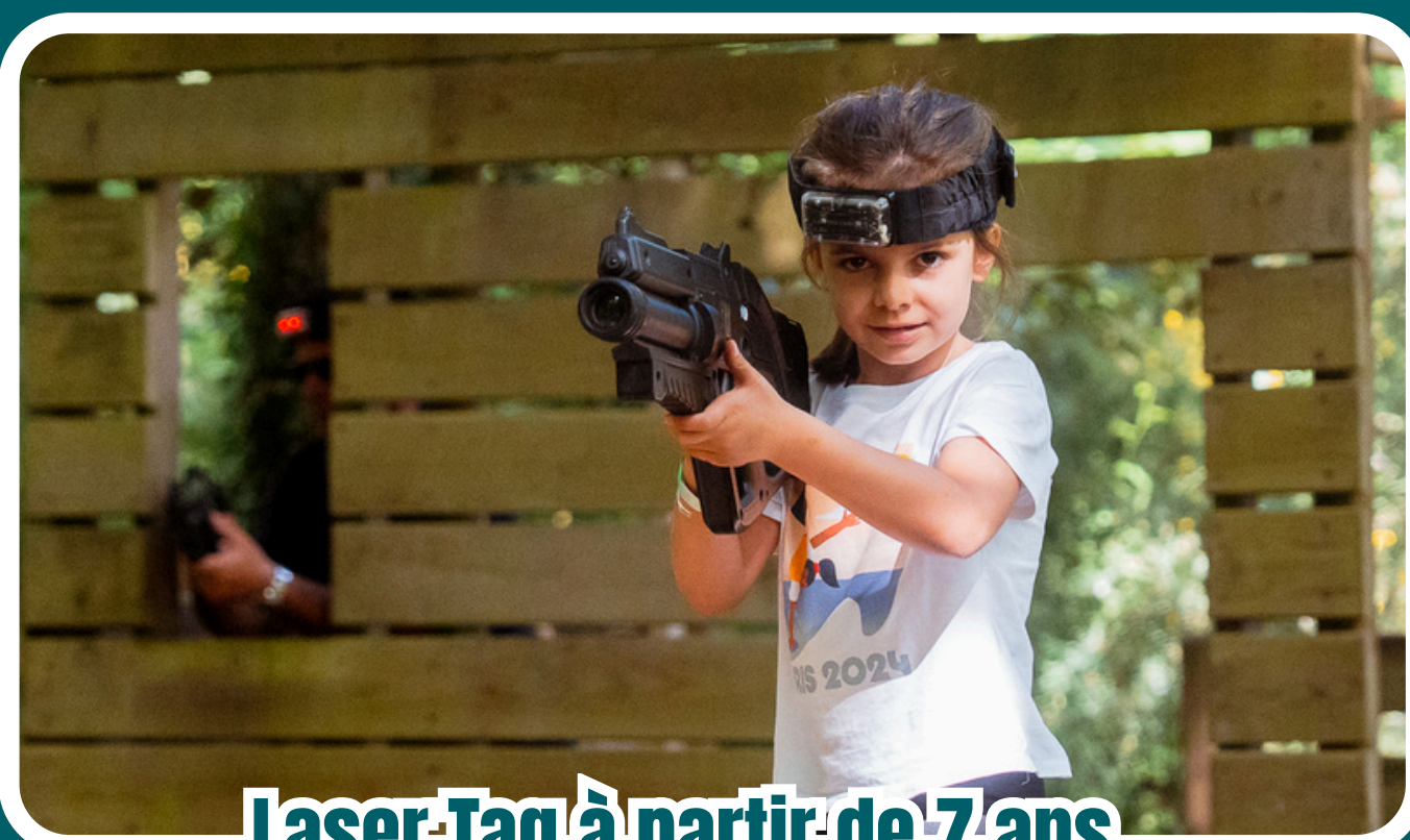
Laser-Tag à partir de 7 ans