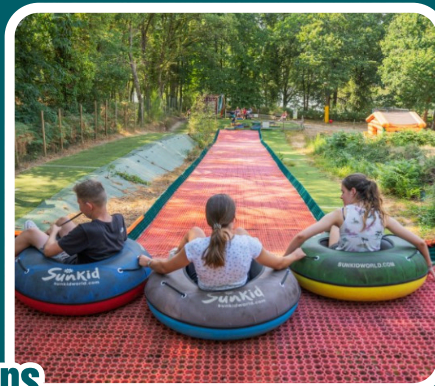
Une soixantaine de jeux, dès 3 ans