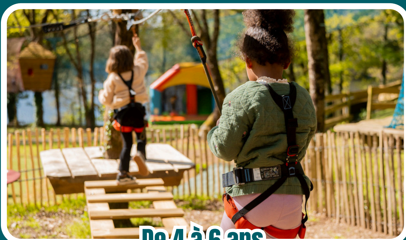
De 4 à 6 ans