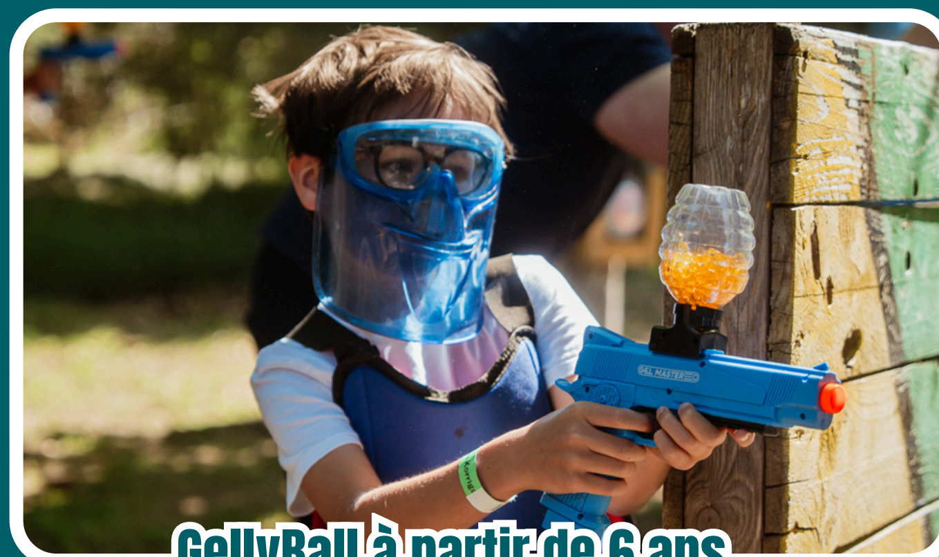
GellyBall à partir de 6 ans